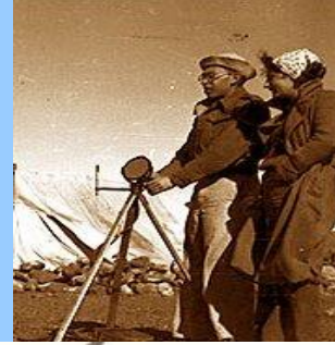
איתות ראייה (הליוגרף, פנס, דגלים)