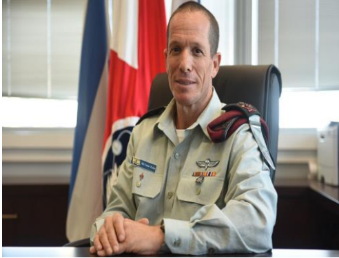
אלוף נדב פדון

נכתב ומופק באתר ההנצחה הצה"לי לחללי חיי"ק ולהנחלת המורשת