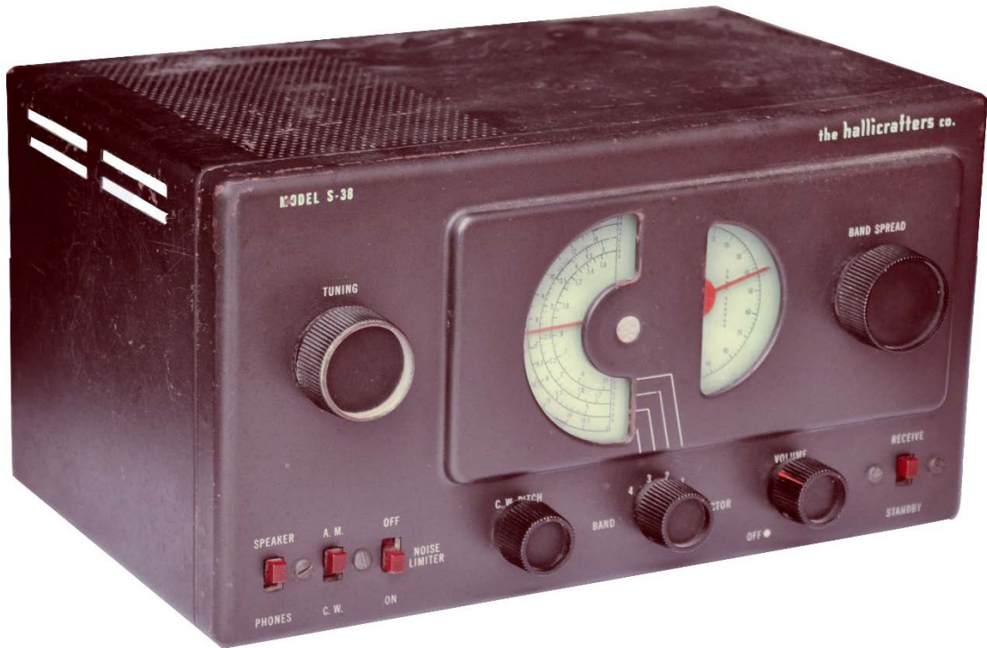
מקלט רדיו S-38 אוסף העמותה להנצחת חללי חיל הקשר והתקשוב

במקלט היו שש שפופרות: מתנד וערבול 12SA7, מגבר תב"ם (תדר ביניים) 12SK7 בתדר 455 קה"ץ, גלאי 12SQ7, מגבר שמע 35L6, מתנד פעימה (Beat Frequency Oscillator - BFO) שיצר אות בתדר 455 קה"ץ לקליטת מורס ומגבל רעש 12SQ7 ומיישר זרם 35Z5.