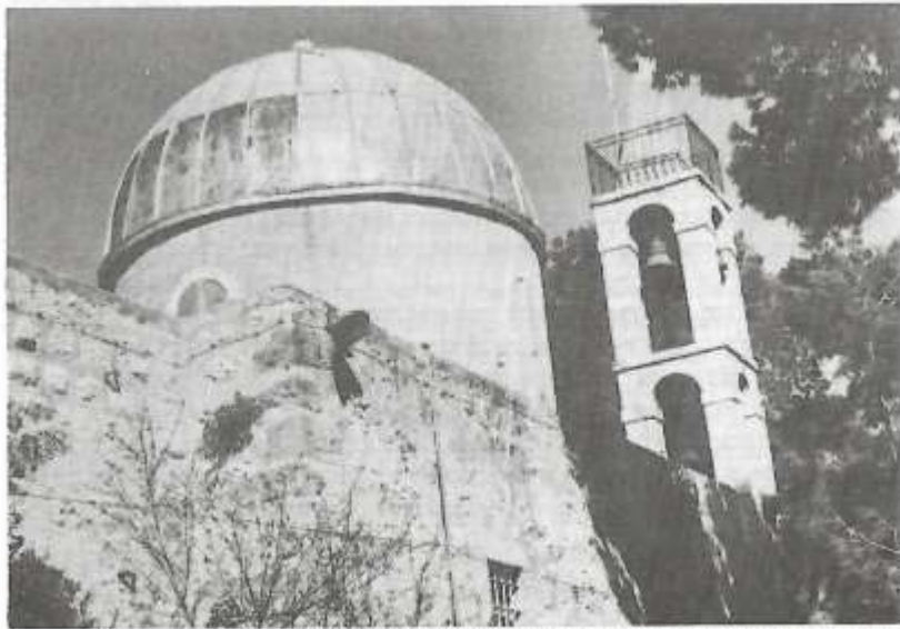
הכיפה והמעמון של מנזר סן-סימון. אש-תופת נוחכה על המונינים שבסביבתם