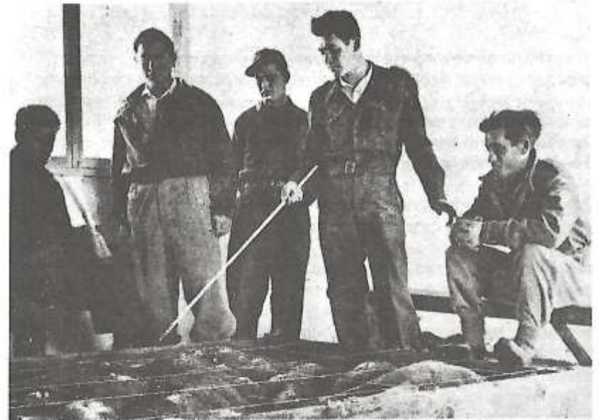
לפני הקרב – סמ"ם דוד אלעזר (דדו), לימים הרמטכ"ל, מסביר את המהלכים הצפויים, ליד שולחן-החול