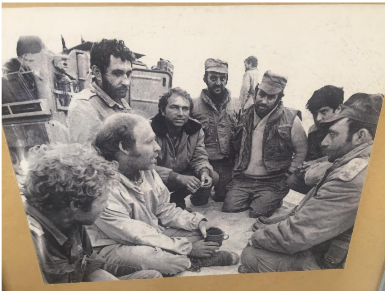
המספר בקבוצת תכנון ופקודות חט' על הדיונה באזור "ציונה" לקראת צליחת התעלה 4 (9.10.1973)

בערב הצליחה נגרר גשר הגלילים ע"י 9 טנקים לכיוון הצליחה המיועדת, אלא שבדרך נקרע הגשר, הניסיונות לחברו מחדש כשלו. עמדתי עם חפ"ק המח"ט, ליד הגשר, בניסיונות לתקנו, אך גם כשחובר מחדש וניסה להתקדם, באמצעות 9 הטנקים הגוררים, נותק שוב (הטנקיסטים פשוט נרדמו מעייפות ובהינתן פקודת "נוע", חלקם נע וחלקם עמד במקומו ולכן הגשר נותק שוב ושוב). הגשר לא הצליח להגיע לנקודת הגישור. גם החלופה השנייה שהתבססה על הדוברות לא צלחה. הדוברות נתקעו בפקקים האין-סופיים שנוצרו בציר התנועה "טליסמן" כתוצאה משיירות הטנקים והרק"ם שלנו ושל האויב וכן שיירות לוגיסטיות שהובילו מזון, מים, דלק ועוד. בסופו